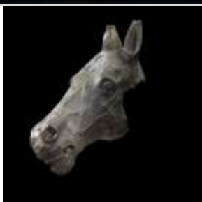
04 Bronzener Pferdekopf aus dem antiken Augsburg. Ende 1. / Anfang 2. Jahrhundert n. Chr. (Römisches Museum Augsburg; Foto: LVR-LandesMuseum Bonn,)