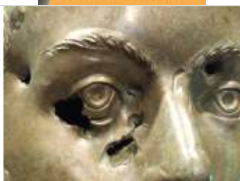
02 Antike Spuren der Gewalt an einem bei Carnuntum gefundenen Bronzeporträt des Kaisers Severus Alexander (222-235 n. Chr.). (Kunstsammlung Ruhr- Universität Bochum).