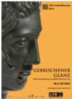
01 Plakat zur Ausstellung LVR-LandesMuseum Bonn