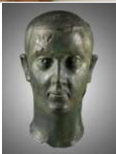
07 Bronzeporträt des Kaisers Gordian III. (238-244 n. Chr.). Gefunden im Lagerdorf des Grenzkastells Niederbieber bei Neuwied. (LVR-LandesMuseum Bonn).