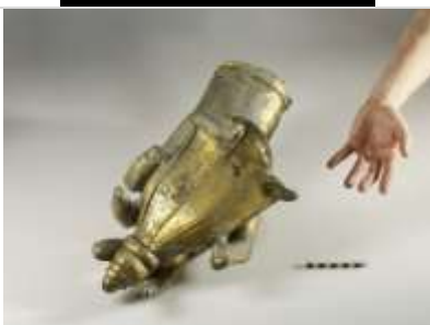
05 Vergoldete Monumentalhand mit Blütenkelch, vielleicht von einem Götterbildnis. Fundort Bregenz. (Vorarlberg Bregenz).