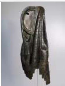
09 Aufwändig verziertes Satteldeckenfragment von einem Reiterstandbild aus dem Rheinland. (LVR- Landesmuseum Bonn).