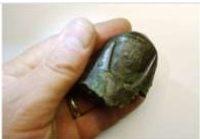
06 Überlebensgroßer Daumen aus dem Bonner Legionslager. (LVR-LandesMuseum Bonn).