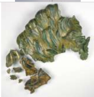
10 Fragment von einem monumentalen Relief mit Darstellung eines Mischwesens. Fundort: Mittelstrimmig im Hunsrück. (Mittelstrimmig Privatbesitz).