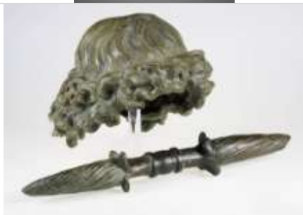
08 Haarkalotte und Blitzbündel einer überlebensgroßen Jupiterstatue aus dem rheinland-pfälzischen Womrath (LVR-LandesMuseum Bonn).