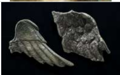
03 Appliken in Form von Flügeln aus dem Limeskastell Aalen. Ehemals Schmuck von Panzerstatuen. (Limesmuseum Aalen).